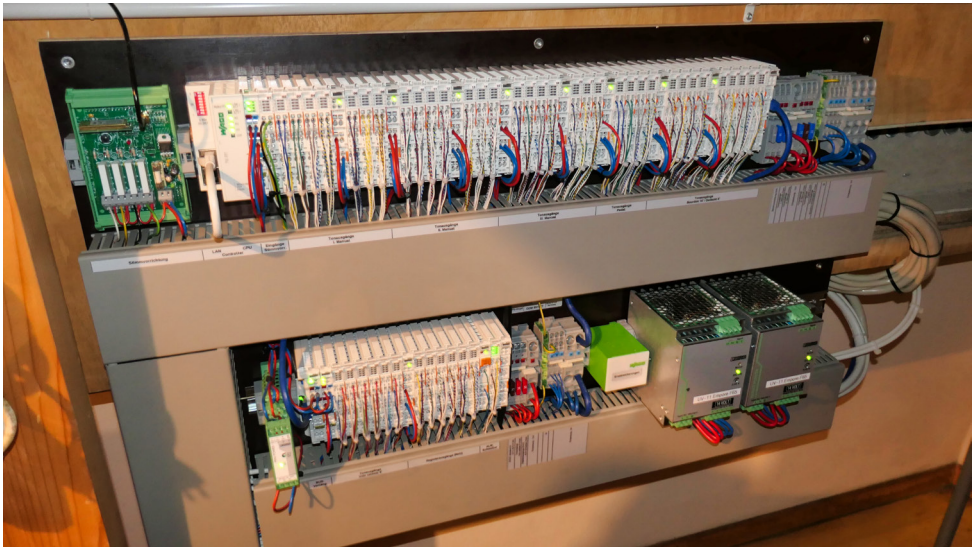
Elektronik hält Einzug in die revidierte Orgel

Warum wurde der Spieltisch von seinem bisherigen Platz auf der Seite der Empore direkt vor die Orgel verschoben, mit Blick in die Kirche? Das habe man lange diskutiert, denn die Traktur sei ja seit je her elektrisch und erlaube daher jeden Standort des Spieltisches. Vielleicht spielten die Schallverzögerungen, die beim seitlichen Standort ev. zu Tage treten, bei der Entscheidungsfindung eine Rolle? Jetzt steht der Spieltisch auf jeden Fall sehr nahe am Schwellwerk, was vielleicht auch nicht optimal ist.