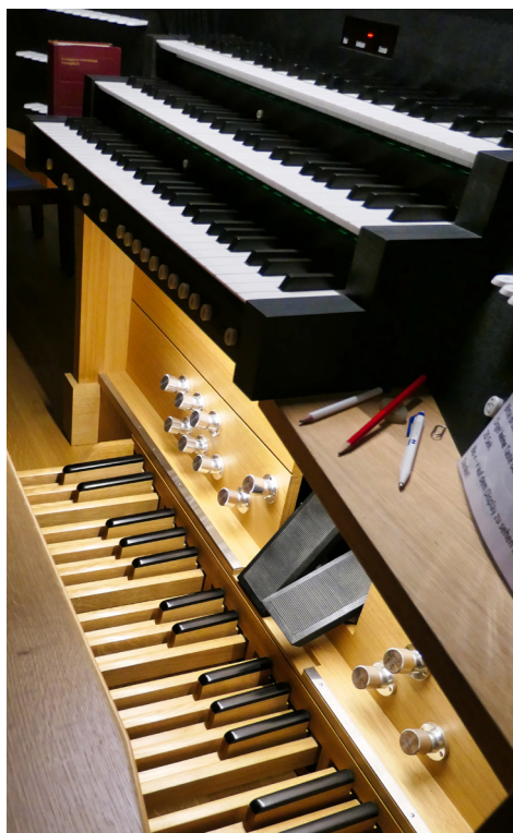
Spieltisch der Kuhn-Orgel

hiess: alles nochmals reinigen. Der Einbau einer neuen elektronischen Steuerung verschlang ebenfalls viel Zeit. So dauerte die Revision bis zu ihrem Abschluss volle 3, mit den Vorarbeiten sogar gegen 4 Monate.