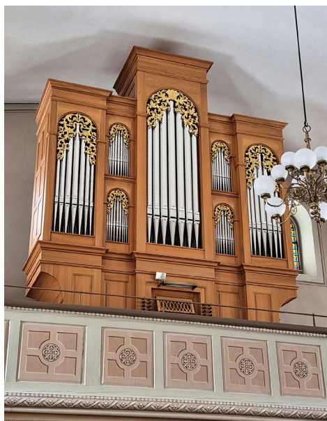
Mathis-Organ Linthal

Der Bus bringt uns daraufhin nach Glarus zum Restaurant Schützenhaus, wo wir zu Mittag essen. Die detaillierten Angaben zur Menüauswahl entnehmen Sie bitte den Anmelde-Unterlagen. Erwähnt seien lediglich zwei Dinge: Das Fleischmenü entspricht dem traditionellen Landsgemeinde-Menü. Und normalerweise haben wir bisher bei den Anmeldeformularen auf die Bestellmöglichkeit eines Desserts verzichtet. Das Schützenhaus bietet jedoch ein typisches kleines Landsgemeinde-Dessert an: 1 Kugel Magenträs Glace mit Rahm und Dessert- huppe. Magenträs ist ein spezieller Glarner Gewürzzucker. Wir haben bei der Rekognoszierung das Dessert gekostet: unbedingt geniessen! Falls Sie dieses Dessert