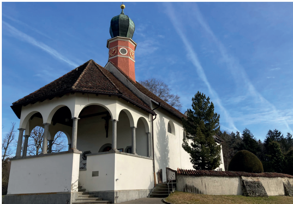
Maria Dreibrunnen