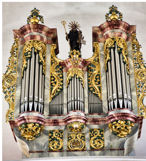
Mathis-Orgel Näfels

Daraufhin wird uns der Bus wieder nach Wil und St. Gallen bringen.