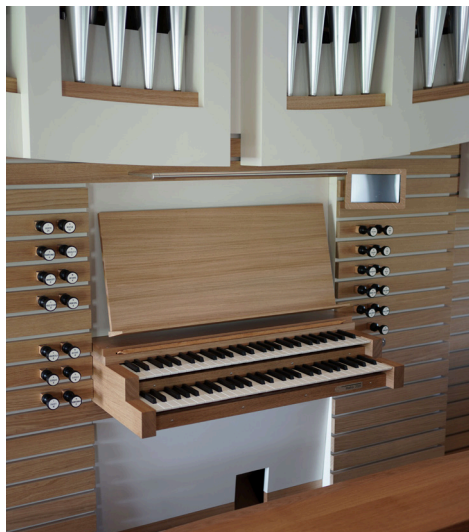
Mathis-Orgel 2024

Kursiv geschriebene Register: Transmission bzw. Verlängerung.