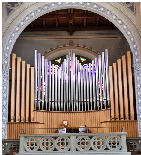
Kuhn-Orgel Glarus