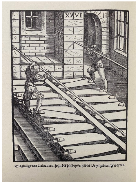
Balgkammer der Orgel von Halberstadt (1361) ©Bärenreiter

Im Folgenden seien einige Windanlagen erläutert.