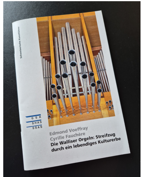
Die Walliser Orgeln: Streifzug durch ein lebendiges Kulturerbe

Das Wallis verfügt über rund 250 Orgeln aus mehr als fünf Jahrhunderten. Die Autoren haben die Auswahl so getroffen, dass sie jeden Bezirk sowie jedes Jahrhundert umfasst, verschiedene Trakturtypen sowie