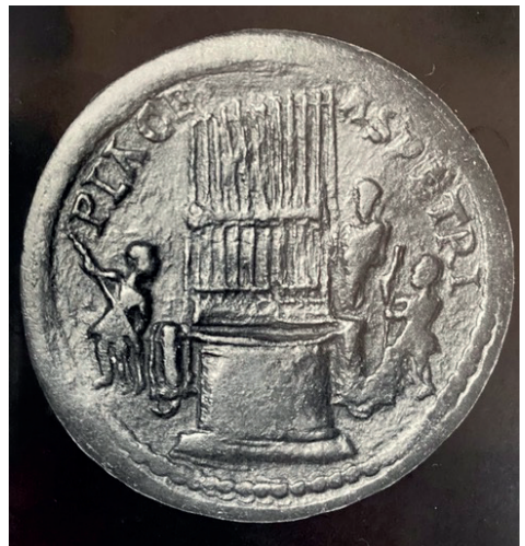
Hydraulos: Abbildung auf einer römischen Münze