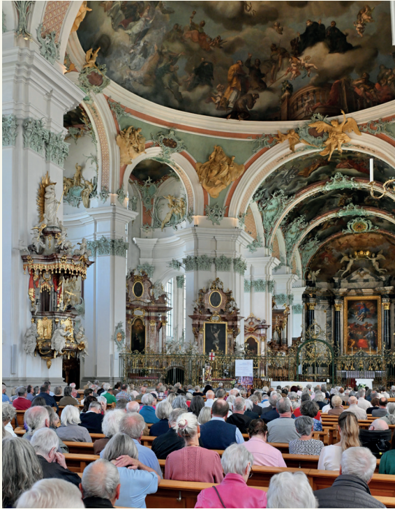
Christoph Schönfelder im DOM ...